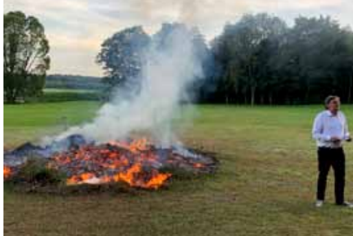
Skt. Hans, Bigum 2019.