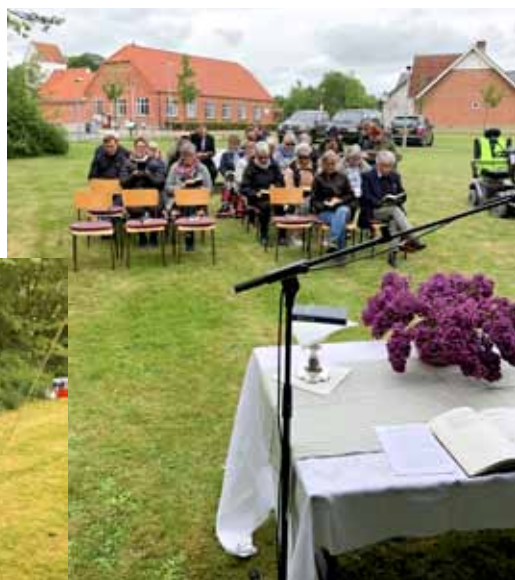
Byfest i Vammen.